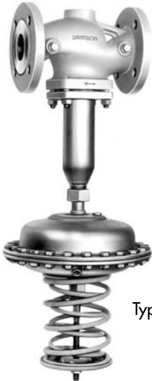
Type 42-24 A