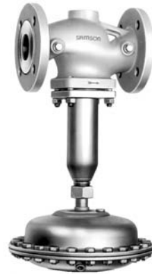
Type 42-28 A