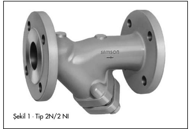
Şekil 1 · Tip 2N/2 NI