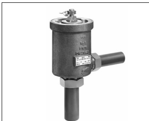
Fig. 1 · Soupape de sécurité type 2302.