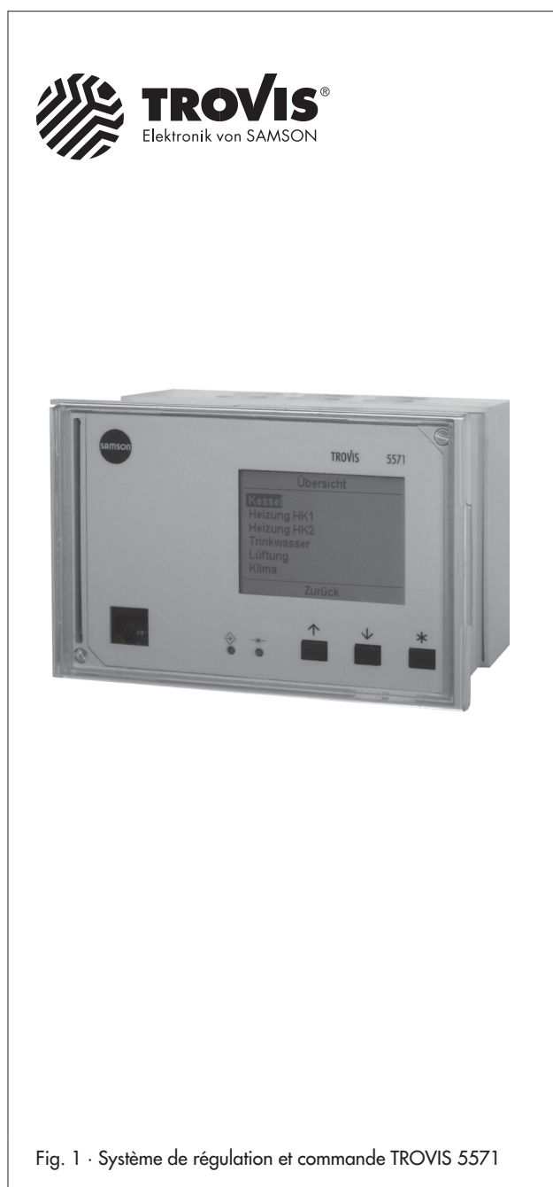
Fig. 1 · Système de régulation et commande TROVIS 5571