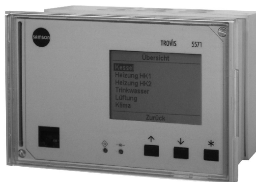
Slika 1 · Programabilni krmilnik (PLC) TROVIS 5571