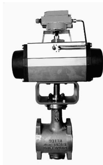
Рис.1 – поворотный клапан с сегментным затвором Maxifluss тип VETEC 72.4/AT, конструкция «сэндвич» согласно ANSI или DIN