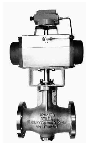
Рис.2 • тип 72.1/AT согласно ANSI или тип 72.3/AT согласно DIN во фланцевом исполнении