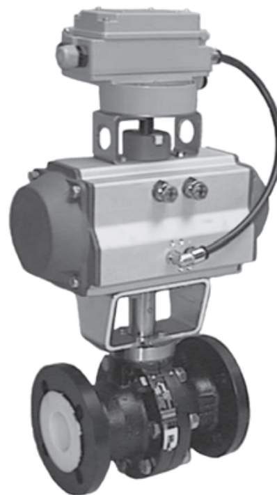
Рис. 1 • Шаровой кран с PTFE-футеровкой Тип BR 20a с пневматическим поворотным приводом Тип BR 31a