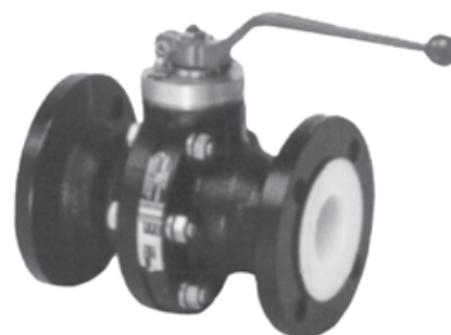
Рис. 1 • Шаровой кран с PTFE-футеровкой Тип BR 20a

Шаровой кран так же доступен от 1/2" до 6" и диапазоном давления по ANSI Class 150.