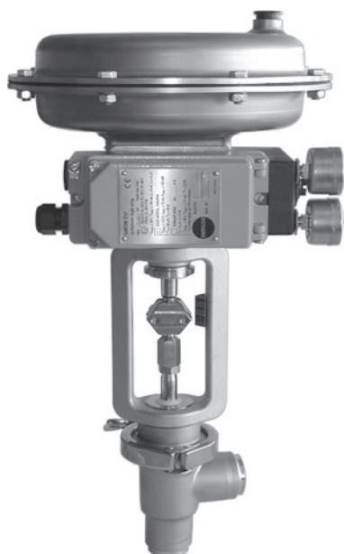
Tipo 3347-7 con cuerpo en fundición con extremos para soldar