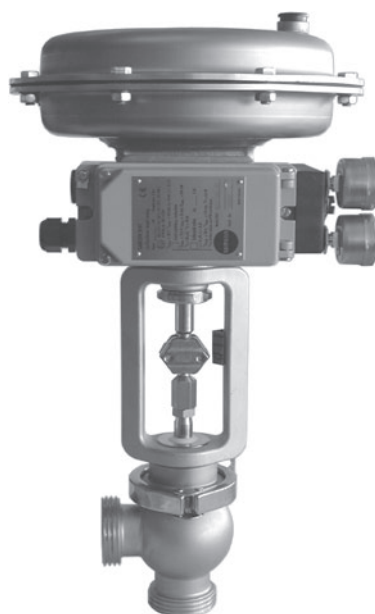
Tipo 3347-7 con cuerpo en material de bloque, con conexiones roscadas