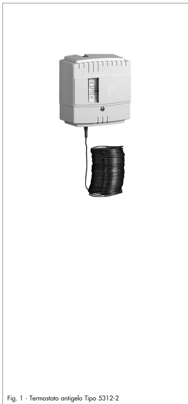
Fig. 1 · Termostato antigelo Tipo 5312-2