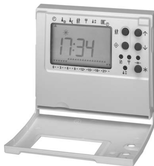
Rys. 1 · Regulator pokojowy TROVIS 5570 z otwartą pokrywą