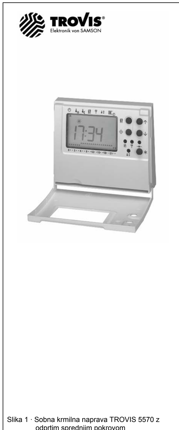
Slika 1 · Sobna krmilna naprava TROVIS 5570 z odprtim sprednjim pokrovom

Izbiro in nastavitvev različnih parametrov izvršimo s pomočjo tipk \uparrow , \downarrow in \text{✱} .