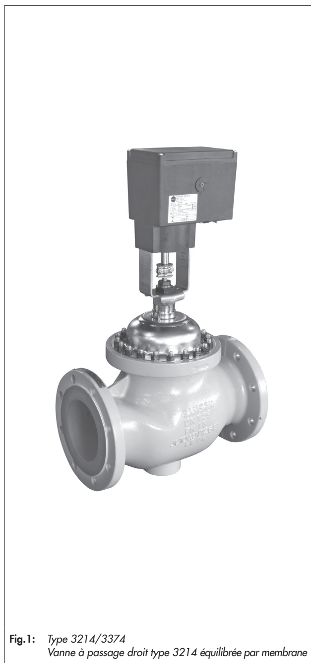
Fig. 1: Type 3214/3374 Vanne à passage droit type 3214 équilibrée par membrane