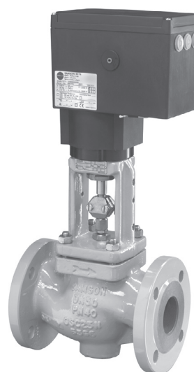
Fig. 1 : Type 3241/3374