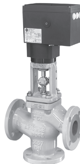
Fig. 2 : Type 3244/3374

Notice récapitulative correspondante ► T 5800