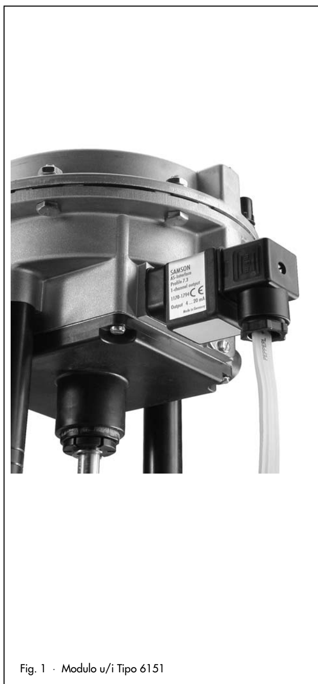
Fig. 1 · Modulo u/i Tipo 6151

1) Convertitore i/p Tipo 6111 in versione speciale