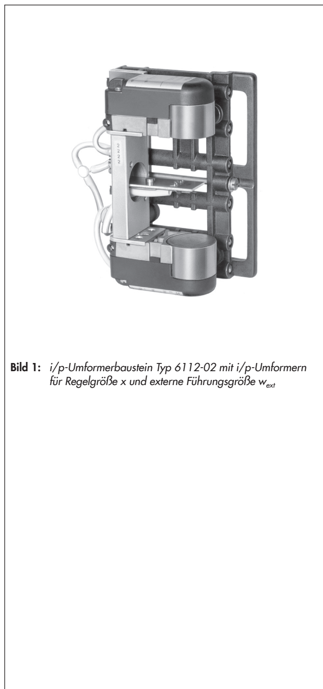
Bild 1: i/p-Umformerbaustein Typ 6112-02 mit i/p-Umformern für Regelgröße x und externe Führungsgröße w_{ext}