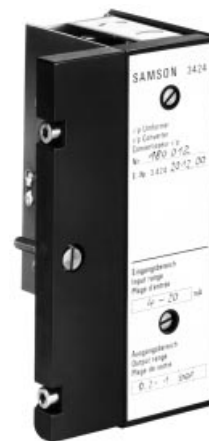
Rys. 2 · Samodzielny przetwornik i/p typu 424-11 z płytką do podłączenia wyjść

Oferujemy także wykonanie z przetwornikiem i/p wielkości regulowanej x i/lub przetwornikiem i/p zewnętrznej wartości zadanej w_{ext} . Szczegółowe informacje podajemy na życzenie.