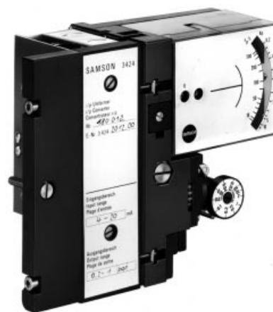
Rys. 1 · Przetwornik i/p typu 424-10 z modułem regulacyjnym PI typu 423-2

Typ 424-21 · moduł przetwornika do montażu w stacyjkach regulacyjnych typu 422, z płytką do podłączenia wyjść o wydatku powietrza > 1,5 \text{ m}_n^3/\text{h}