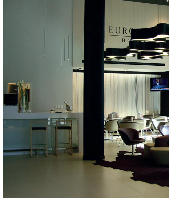
Das Hotel besticht durch modernes Design. The hotel is characterised by modern design.

Gerade in einem Hotel mit gehobener Ausstattung spielt die Regelung der Raumkonditionen eine zentrale Rolle. Das BACnet Automationssystem der SAMSON AG erfüllt diese hohen Anforderungen.