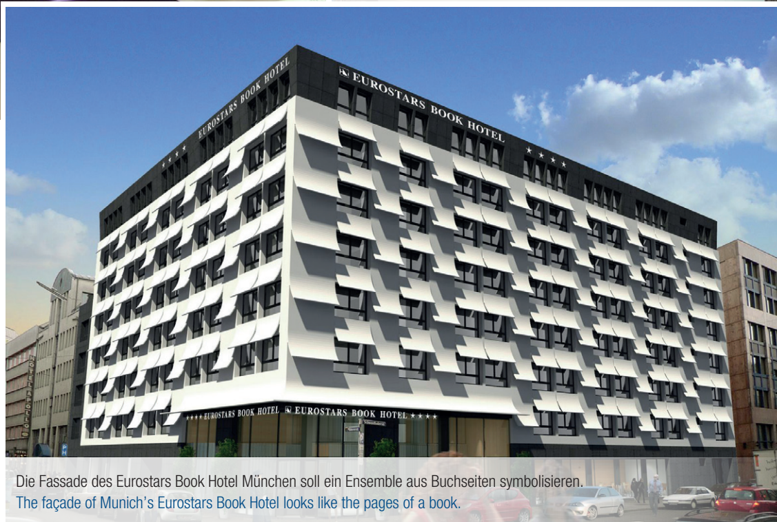
Die Fassade des Eurostars Book Hotel München soll ein Ensemble aus Buchseiten symbolisieren. The façade of Munich's Eurostars Book Hotel looks like the pages of a book.

named after different literary genres and works. The innovative hotel offers 201 rooms – eight of which are exclusive suites – with the latest conveniences. It was opened just in time for the 2012 Oktoberfest.