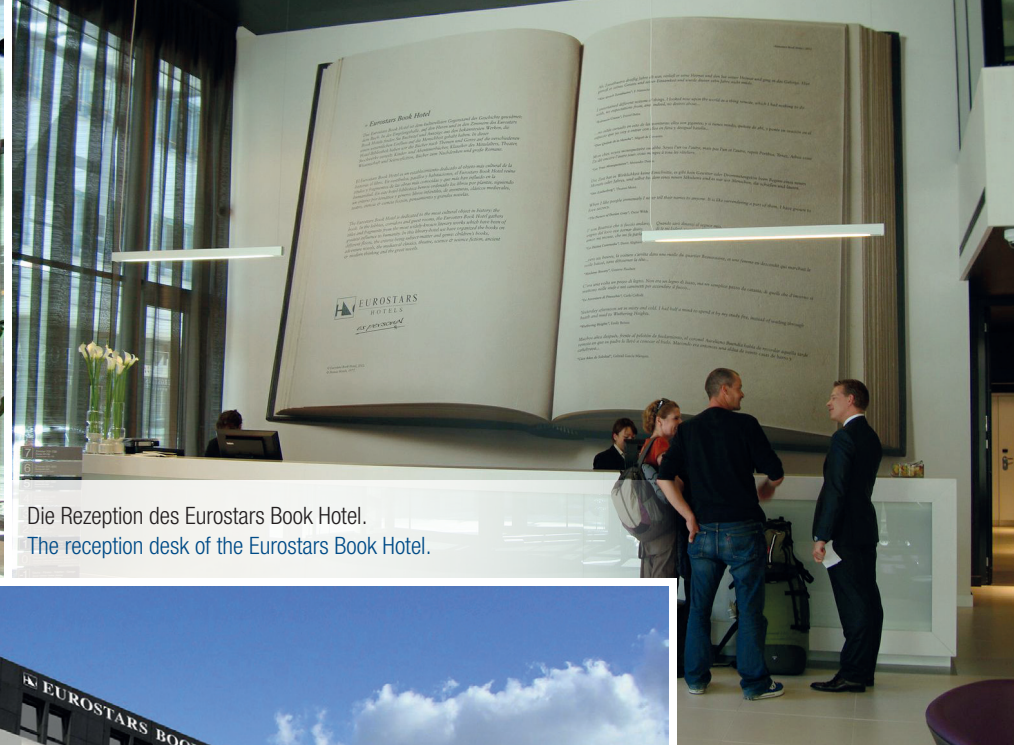
Die Rezeption des Eurostars Book Hotel. The reception desk of the Eurostars Book Hotel.